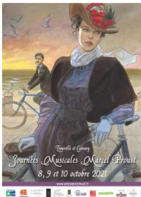
L'affiche de la 5 ème édition, par Jean-Pierre Gibrat, très célèbre dans le monde de la BD.